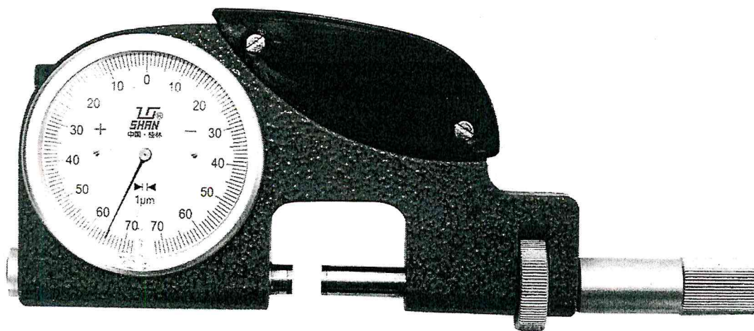
Рисунок 1 – Общий вид скоб с верхним пределом диапазона измерений до 100 мм

- Товарный знак «SHAN» наносится на паспорт скоб типографским методом, на циферблат отсчетного устройства и футляр скоб краской или методом лазерной маркировки.