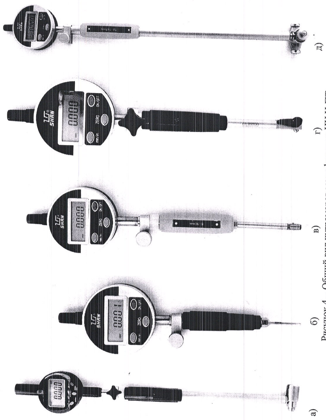
Рисунок 4 – Общий вид нутромеров модификации НИ Ц-ПТ