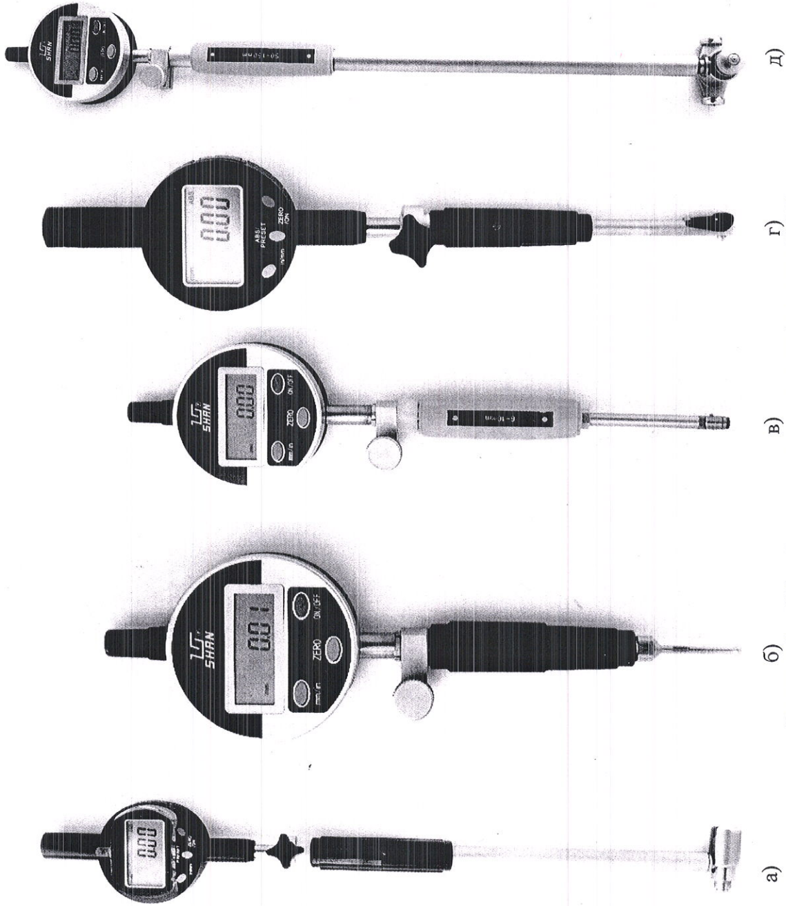
а) б) в) г) д) Рисунок 2 – Общий вид нутромеров модификации НИ Ц