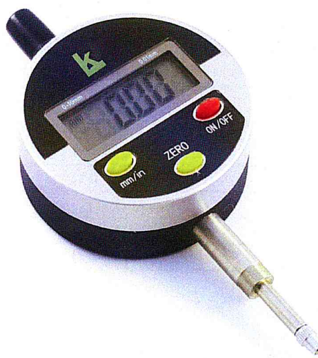
Рисунок 2 – Общий вид индикаторов ИЧЦ