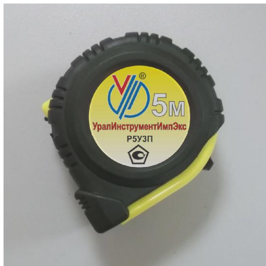
а) рулетка в закрытом корпусе

Внешний вид рулеток представлен на рисунке 1.