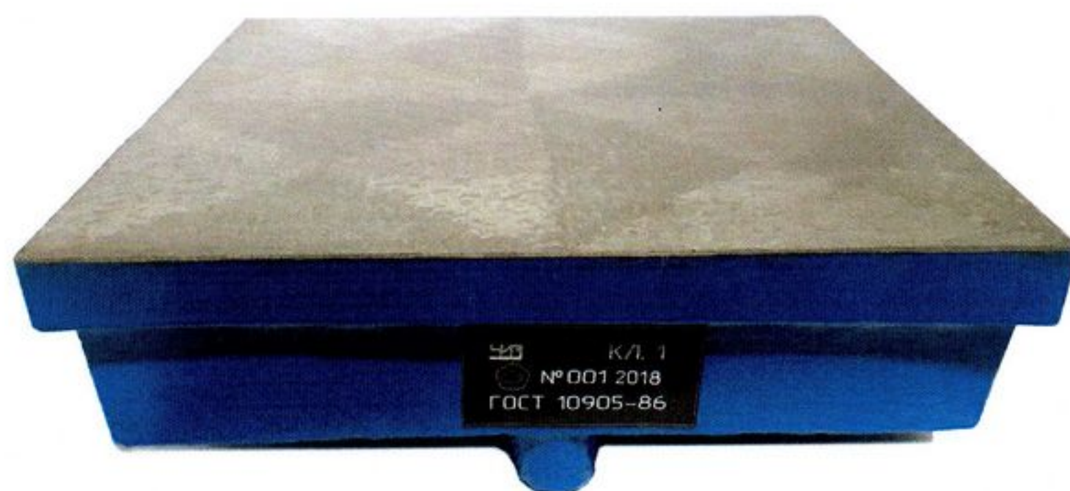
Рисунок 2 – Общий вид плиты поверочной и разметочной исполнения 2